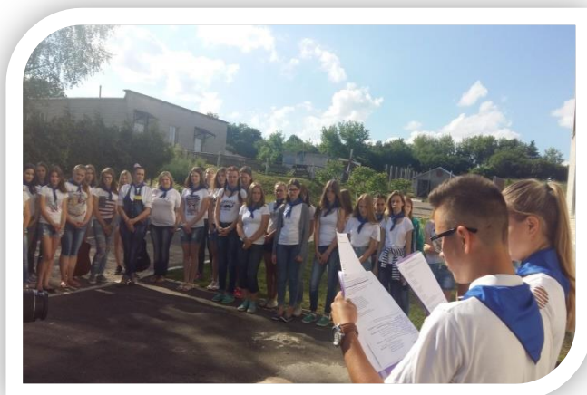
Церемония открытия «Лето-это маленькая жизнь!»