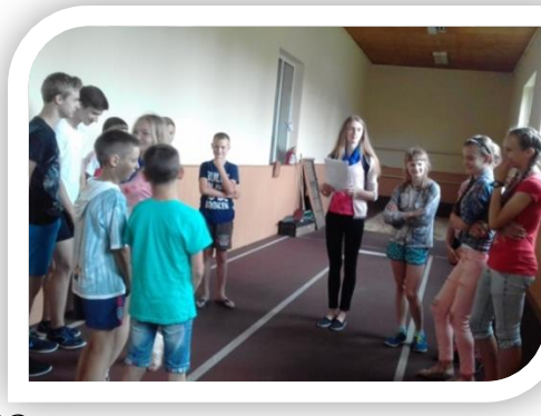
Творческая площадка в ОЛ «Юный олимпиец» ГУО «СДЮШОР №1 г. Волковыска»