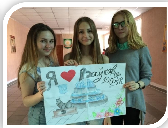
Интеллектуально - познавательная игра «Моя Волковыщина»