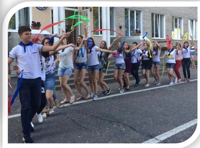
Концертная программа «До свидания, лагерь!»