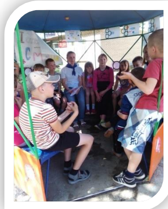
Творческая площадка в ОЛ «Россь»