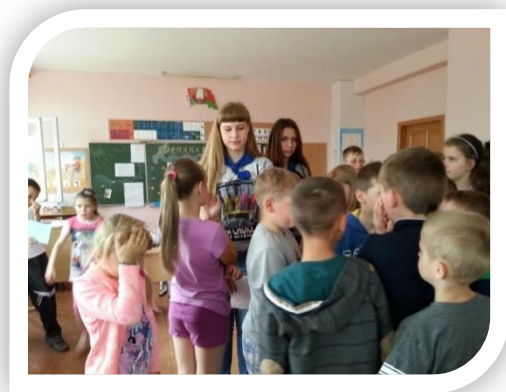
Творческая площадка в ОЛ «БРИЗ» ГУО «СШ № 7 г. Волковыска»