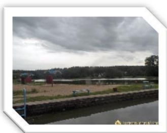
Пляжная зона водохранилища «Дамба»