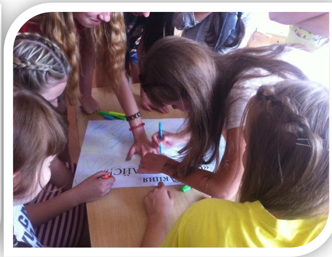
Акция «СТОП – СПАЙСЫ»