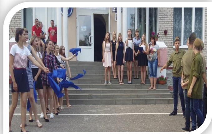
Конкурс инсценированной песни «Песни Победы»