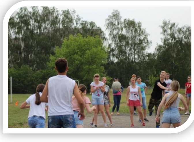
Спортивная игра «Два капитана»