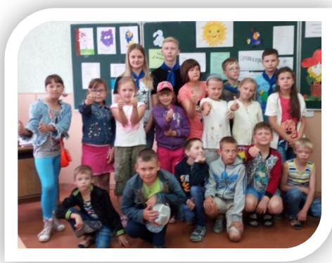
Творческая площадка в ОЛ «Солнышко» ГУО «СШ №2 г. Волковыска»