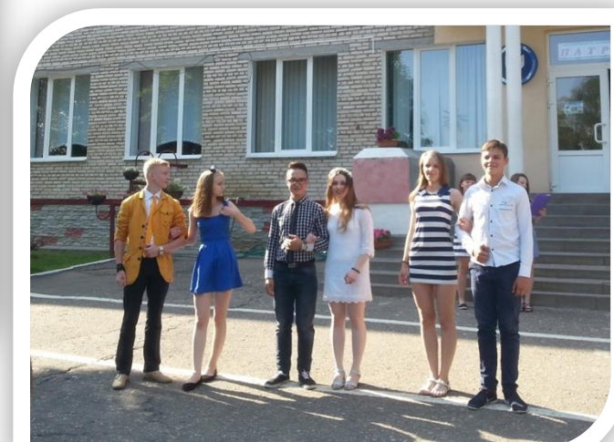
Шоу-программа «А ну-ка, парочки»