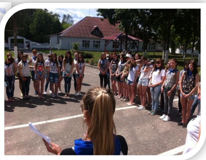
Линейка закрытия лагеря