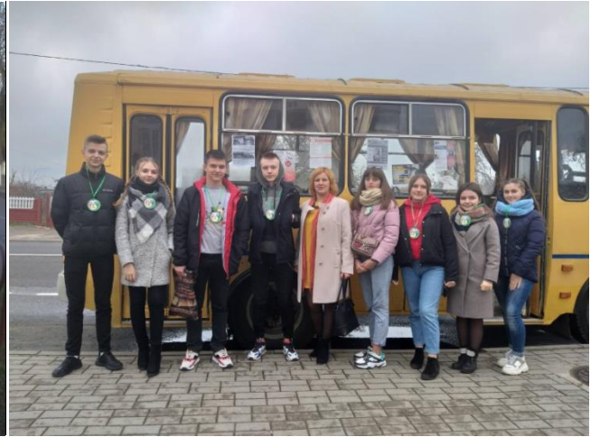
Фото 3. Антинаркотический десант «AgitBus»