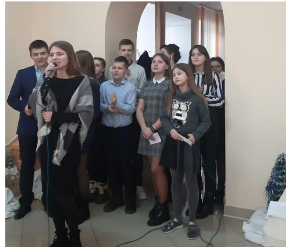
Фото 4. Акция «Подари другому радость»