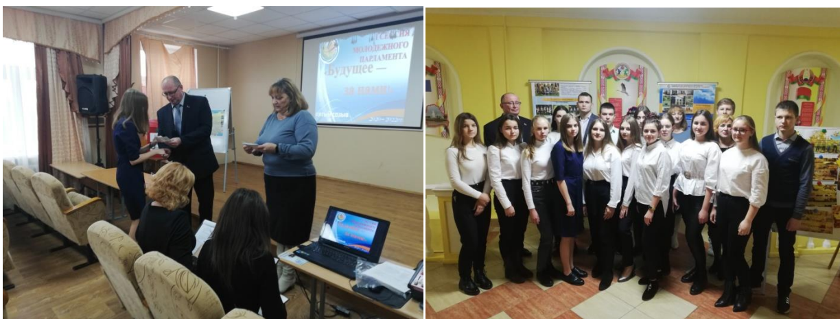
Фото 2. 1 сессия Молодежного парламента 5 созыва