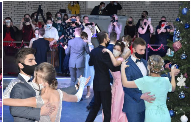
Фото 5. Рождественский бал для старшеклассников