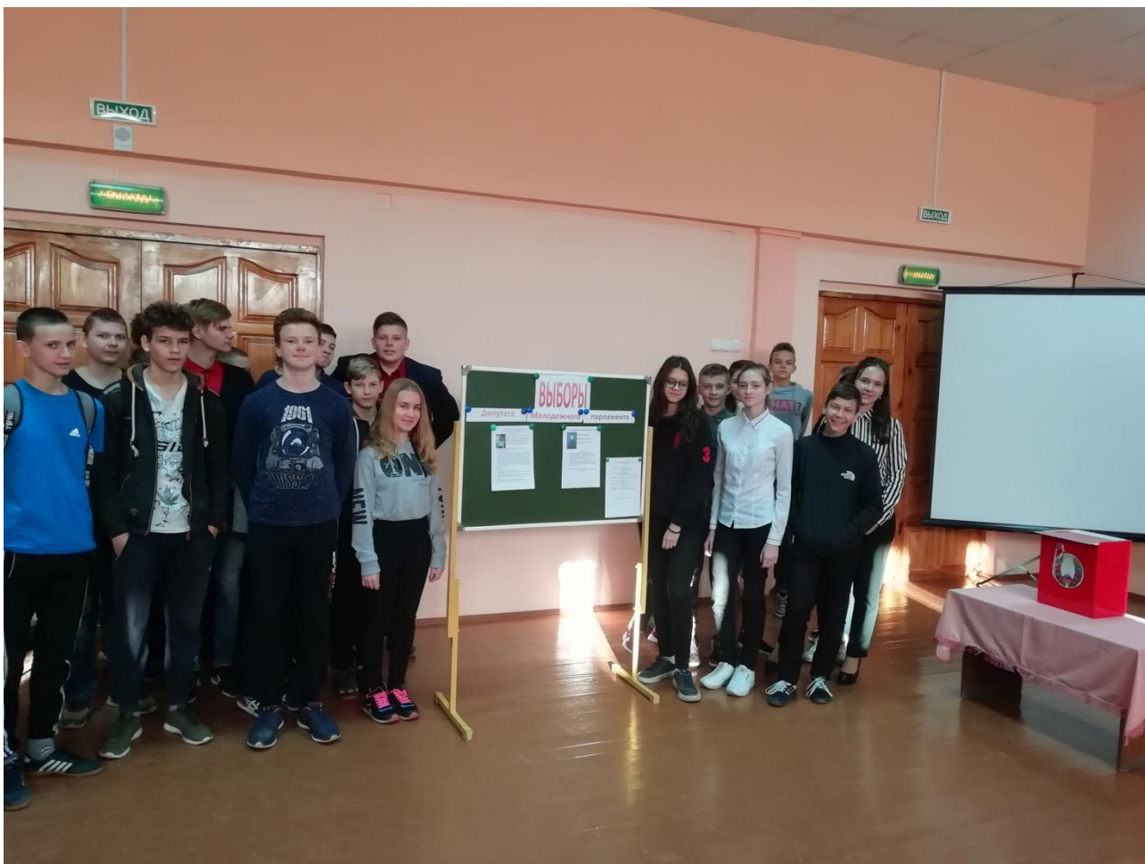
Фото 1. Выборы в районный Молодежный парламент 5 созыва