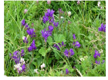
Сиреневый репях полевой