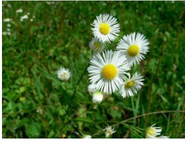
Дикая ромашковая астра