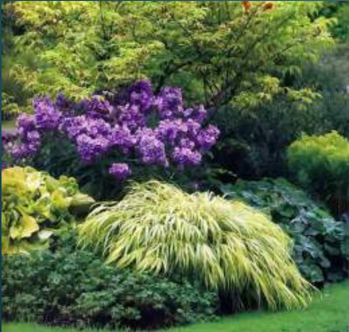
Контраст по форме куста и фактуре листьев