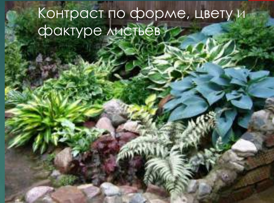
Контраст по форме, цвету и фактуре листьев