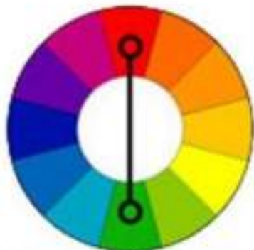
комплиментарные или дополнительные цвета