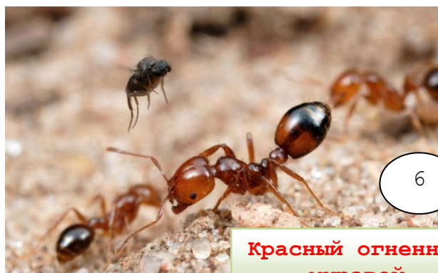
Красный огненный муравей