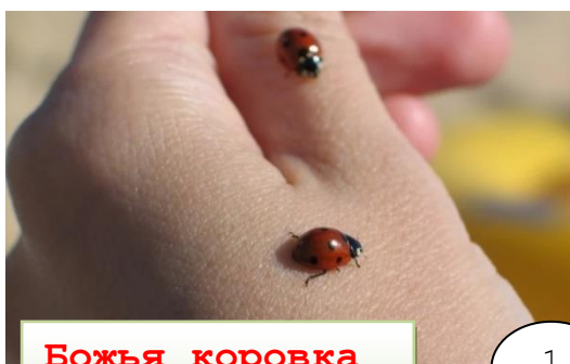
Божья коровка семиточечная

Разнообразие насекомых на территории учебно-опытного участка эколого-биологического отделения